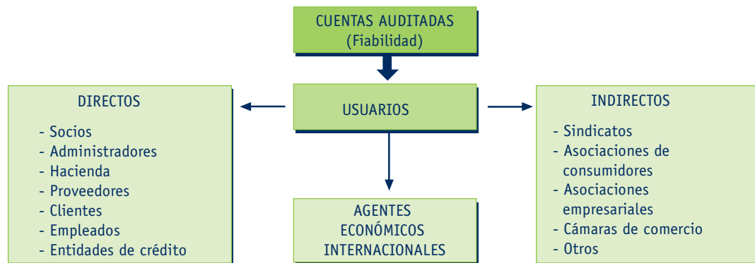
Figura 1.2. Usuarios de la información contable.

La Figura 1.2 ilustra los usuarios de la información contable: